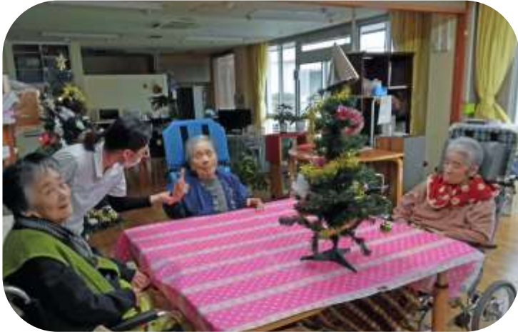
クリスマスパーティでのひととき