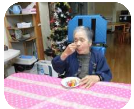
クリスマスパーティはみんなで切ったフルーツをブッシュドノエルにデコレーションしていただきました