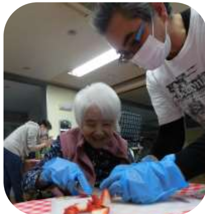
みなさん包丁を使って丁寧にフルーツをカット