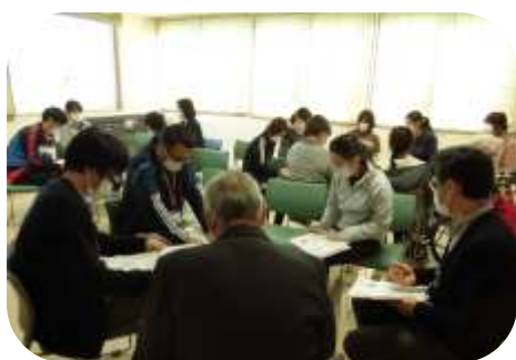
グループ討議中の職員

私たちが仕事をするにあたって、知識や技術の習得はもちろん大事ですが、ご利用者は人生の先輩であり、また自分たちが通っていく道でもあり、「世話をしている」ではなく「お世話をさせて貰っている」と言うことを忘れず、多職種で連携しチームとして組織として取り組んでいくことが重要であることも学びました。