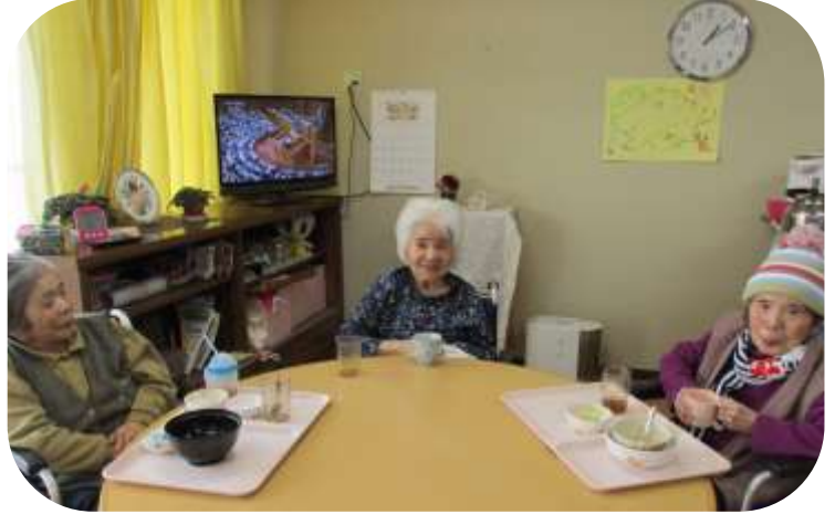
家庭的な雰囲気にして少しでもくつろげる空間を作っています