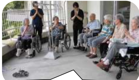
ようこそおいでいただきました