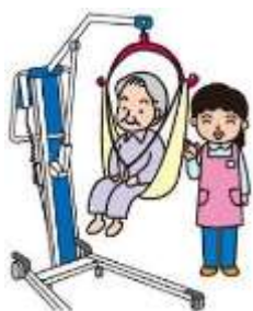
床走行式電動介護リフト