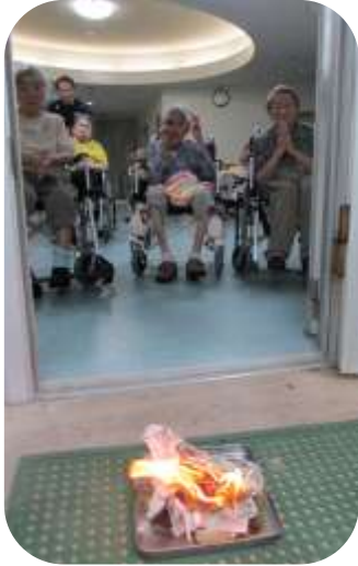
8/13 迎え火・8/15 送り火