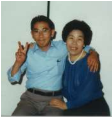
50歳頃 奥さんと仲むつまじく