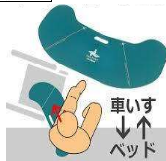
イージーモーション