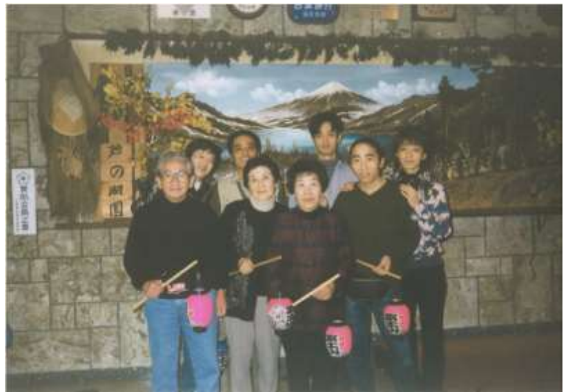
東京にて （新さん前列左60歳頃）