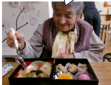
◇敬老会祝い膳メニュー◇ 赤飯、鯛の塩焼き、天ぷら、炊き合わせ、 千草焼き、ナスの酢物、まんじゅう、みかん