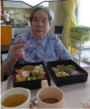
普段よりも食事が 進みます！