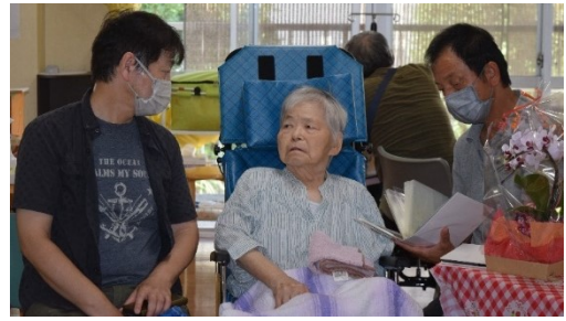
息子さんたちにお祝いされて うれしそう