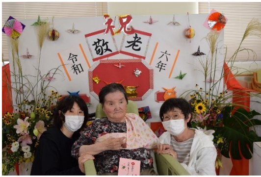
娘さんたちとの記念撮影に 少し緊張気味