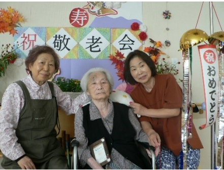
これはごちそうですな