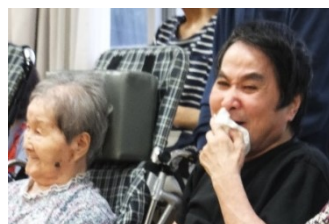
獅子舞に感極まって思わず涙