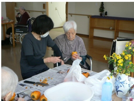
去年は干し柿作りにも挑戦