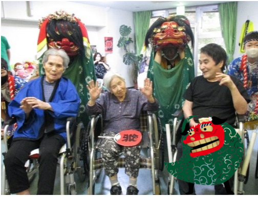
獅子舞後に笑顔で記念撮影