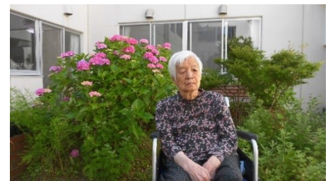
天気の良いときは 中庭で日向ぼっこ この日は梅雨の合間に アジサイバックに記念撮影