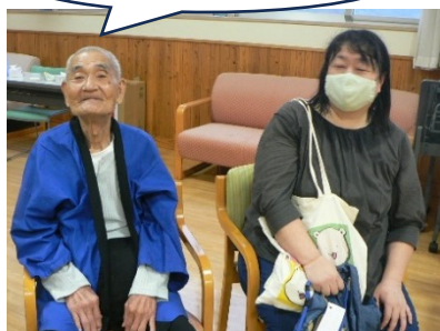
娘さんとの記念撮影