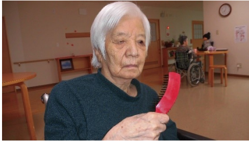
起床時髪を梳いて整えます