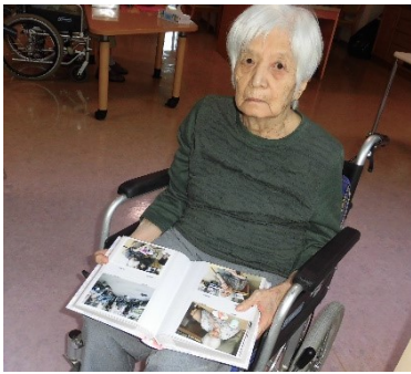
時々アルバムを見て昔を懐かshられています