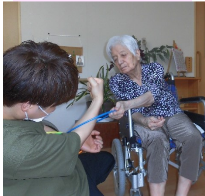
職員と一緒にゲーム