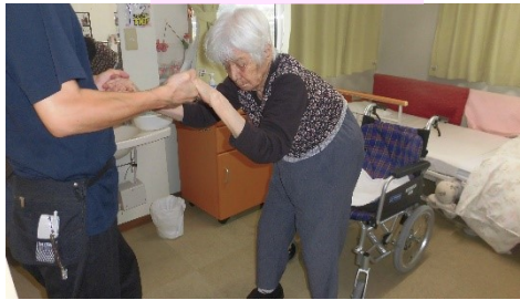
毎日歩く練習をしています