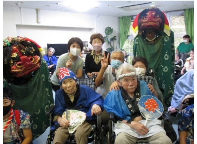
親戚同士で記念撮影